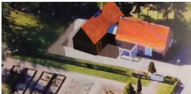
Tidlig skitse der viser ideen til det ny maskinhus i tilknytning til graverfaciliteterne. De endelige tegninger er justeret en smule.

Efter Menighedsråds-valget i 2016 var en af de første ting vi tog beslutning om, at undersøge muligheden for at forbedre graverfaciliteterne, der absolut ikke var tidssvarende. Det drejer sig især om graverhuset som både fungerer som kontor, personalekøkken og maskinrum. Eftersom der er blevet behov for flere og større maskiner, er det uhensigtsmæssige rammer. Samtaler mellem graver og borgere bør efter vores mening have bedre rammer.