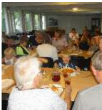
Og så var der pasta – også uden skruer – bagefjer.